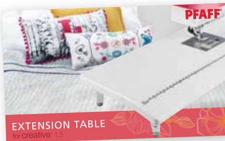
EXTENSION TABLE for creative 1.5

Unter pfaff.com können Sie in einer Riesenauswahl an Stickdesigns, Tipps und Anleitungen stöbern. Lassen Sie sich hier inspirieren oder stöbern Sie im umfangreichen Zubehörsortiment!